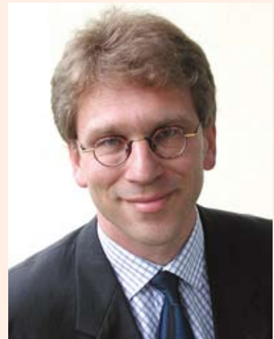
Olav Fykse Tveit.