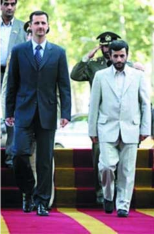
President Bashar Assad av Syria (t.v.) og president Mahmoud Ahmadinejad av Iran (t.h.) er allierte i støtten til Hisbollah. Den 15. august 2006 uttalte han til den egyptiske avisen "Al Usbu": "Syria er klar til krig mot Israel. Syria og Hisbollah kan klart se konfrontasjonsdagen nå nærmer seg".