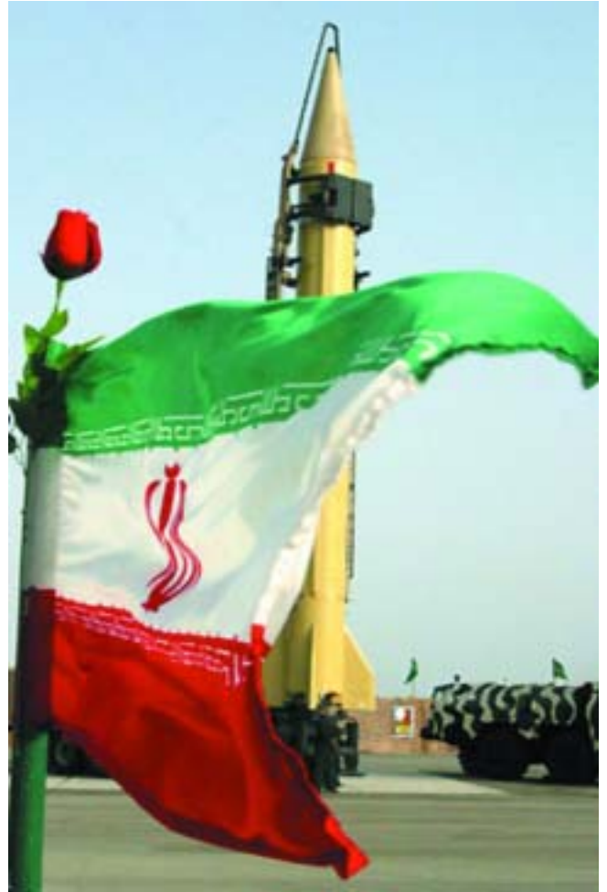
Irans vitenskapsmenn arbeider på spreng med å utvikle sine forskjellige typer langdistanseraketter, og har også kontakt med Nord-Koreas rakettutbygging og atomprogram som videreformidler sin teknologi til Iran.

kjernefysisk teknologi for fredelig kraftindustri. Men resten av verden stoler ikke på Iran, som har noen av verdens største oljekilder, og som prøvde å hemmeligholde sitt atomprogram helt til 2005.