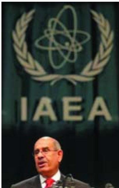
Det Internasjonale Atomenergibyrået (IAEA) og dets generaldirektør Mohammed ElBaradei, fikk Nobels fredspris i Oslo 2005.