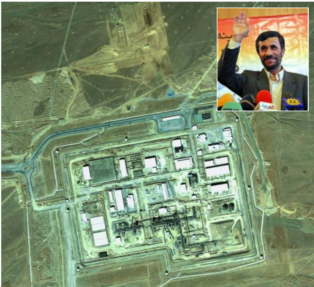
Fra Irans tungvannsfabrikk for framstilling av kjernefysisk materiale i Arak, sørvest for Teheran. De norske frihetskjemperne som ødela tyskernes tungvannsfabrikk på Rjukan under 2. verdenskrig, hindret i siste øyeblikk at Hitlers nazister fikk atomvåpen. Irans president Mahmoud Ahmadinejad nekter også for at det jødiske Holocaust har skjedd. Innfelt: Irans president Mahmoud Ahmadinejad, som oppfordrer til utslettelse av staten Israel, prøver også å lure EU og USA angående persernes kjernefysiske anlegg og anriking av uran for atomvåpen.

om Amalek over hele jorden. Så bygde Moses et alter og kalte det: JEHOVAH NISSI – Herren er mitt seiersbanner. Og han sa: En hånd er utstrakt fra Herrens trone! Herren skal stride mot Amalek fra slekt til slekt ” (2:Mos.17:14-16).