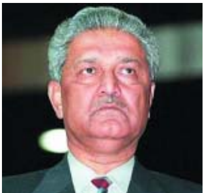
Den pakistanske atombombes far, Abdul Qadir Khan, solgte kjernefysisk teknologi og materiale i mange år til Iran, Nord-Korea, Libya og trolig også til terroristorganisasjoner før han ble oppdaget.