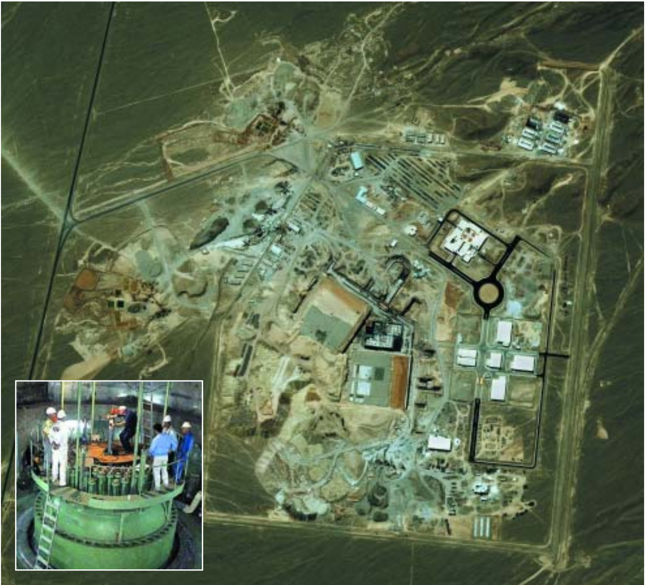
Irans kjernefysiske anlegg i Natanz der Mohammed ElBaradei og IAEA oppdaget at perserne anriket uranium som brukes for atombomber. Fra februar 2006 fjernet Iran alt IAEOs overvåkings- og kontrollutstyr ved alle atomanlegg. Innfelt: Iran har mange kjernefysiske anlegg. Dette er fra halvøya Bushehr ved Den persiske golf.

apostler. Det kan vi se fra alle sitatene fra Det gamle testamentet som brukes i Det nye testamentet.